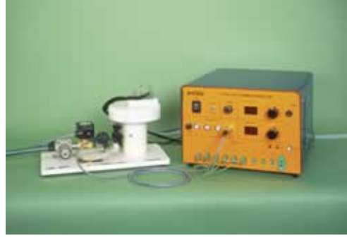
Şekil 2. Radyal Isı Aktarımı Deney Düzenegi