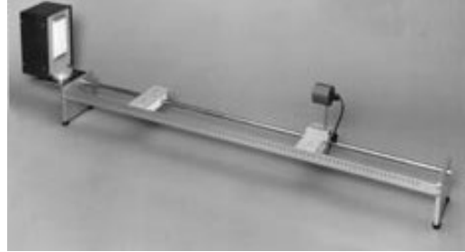
Şekil 1. Deney düzeneği