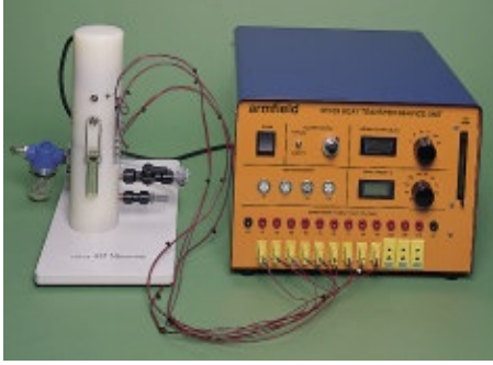
Şekil 1. Lineer Isı Aktarımı Deney Düzenegi